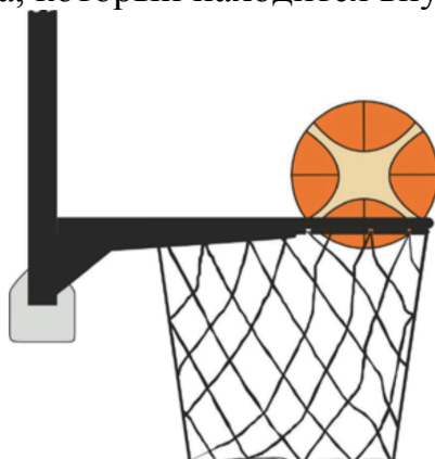
Diagram 3 Ball is within the basket

31-17. Определение: Считается нарушением, если защитник касается мяча, который находится внутри корзины.